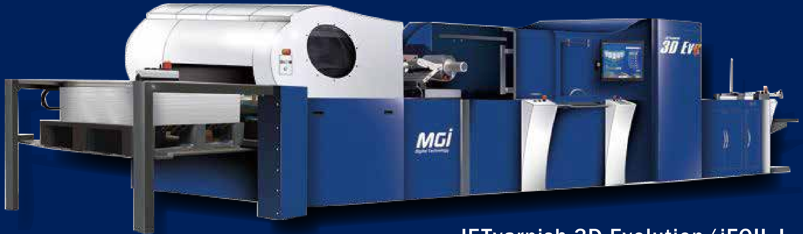
JETvarnish 3D Evolution/iFOIL L